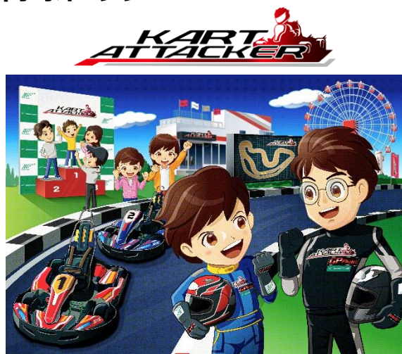
KART ATTACKER イメージイラスト