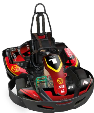
マシンイメージイラスト

デビューステージで基準タイムをクリアしたドライバーが挑戦できるステージです。デビューステージより時速10km速い、最高時速約35kmのマシンを操り、ドライバーはそれぞれで自己ベストタイムを目指してタイムアタックします。