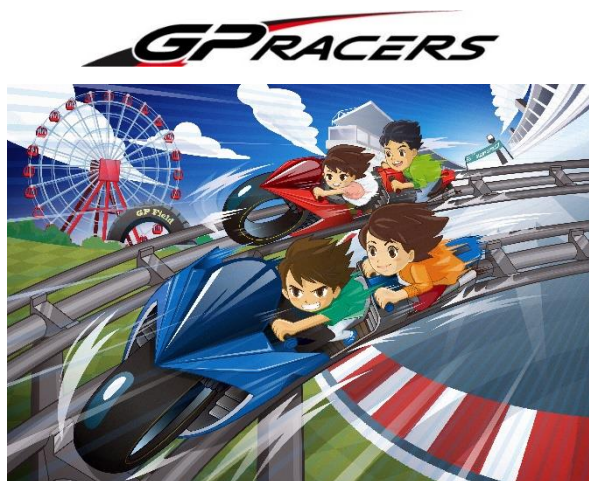
GP RACERS イメージイラスト