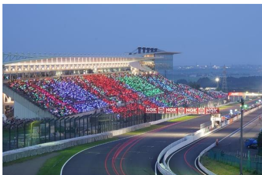
※実際の鈴鹿8時間耐久レース時のグランドスタンド写真