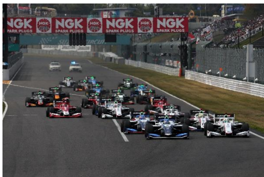
2019年 スーパーフォーミュラ開幕戦スタートシーン

「FIA WTCR(ワールド・ツーリングカー・カップ)」は2018年より新しく発足したツーリングカーレースです。元F1ドライバーなど多数のトップドライバーが参戦しており、2018年の鈴鹿サーキット初開催レースでも、ツーリングカーレースならではの激しい接近戦が展開され話題となりました。