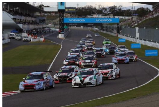
2018年 FIA WTCR JVCKENWOOD Race of Japanスタートシーン