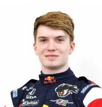
ダニエル・ティクトウム