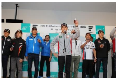
過去のシーズンエンドパーティーの様子

スーパーフォーミュラ2018年シーズンを締めくくるお客様参加型のパーティーイベントで、最終的に年間ドライバーポイント1位～6位までに入ったトップドライバーと、今年デビューのルーキードライバーたちが出演します。ドライバーのサイン入りグッズが当たる大抽選会なども実施いたします。またスペシャルゲストとして小林可梦偉選手のトークショーも実施予定です。