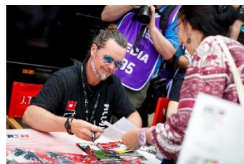
WTCRドライバーサイン会(イメージ)

開催日時 10月27日(土) 10:35～11:10 10月28日(日) 9:40～10:20