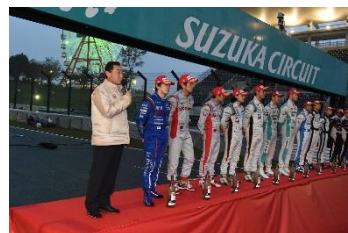
シーズンエンドセレモニー(イメージ)