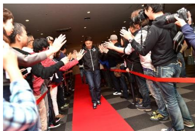
過去のシーズンエンドパーティーの様子