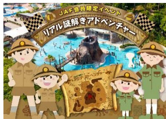
JAFリアル謎解きアドベンチャー イメージ

JAF会員限定のイベントエリアとして、大会期間中開放するゆうえんちモートピアの『アクア・アドベンチャー』を舞台に、謎解きに挑戦いただくイベントを開催いたします。クリア特典として全員にお渡しする景品のほか、抽選でスーパーフォーミュラのドライバーのサインのプレゼントも実施いたします。