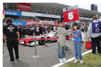
スーパーフォーミュラ グリッドキッズ イメージ

スーパーフォーミュラ最終戦の決勝レース直前、緊張感の漂うホームストレートにゼッケンボードを持って入場し、グリッドに進入するマシンを迎えていただきます。