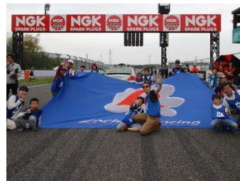
スーパーフォーミュラ フラッグキッズ イメージ

スーパーフォーミュラ最終戦の決勝レース前のセレモニーの一環として、コチラレーシングのビッグフラッグを持ってホームストレートを行進いただけます。