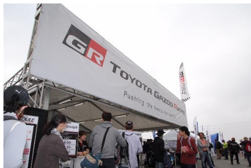
TOYOTA GAZOO Racingブース (イメージ)