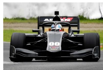
2019年より導入される新型マシンSF19

開催日時 10月26日(金)～28日(日) 場所 Hondaエンジン搭載車:26番ピット(予定) TOYOTAエンジン搭載車:38番ピット(予定)