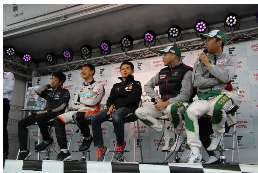
JAF鈴鹿グランプリ オフィシャルステージ (イメージ)