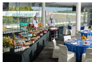
ホスピタリティラウンジ室内

ピットの上階に位置するホスピタリティラウンジでは、広々とした空間で専用のお食事をとお楽しみいただけます。また、テラス席ではピットレーンを見下ろせるためヒストリックマシンの迫力のサウンドも間近でお楽しみいただけます。