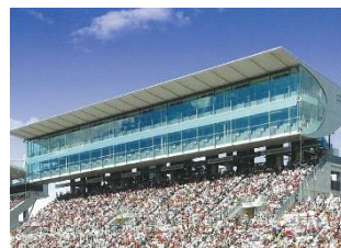
VIPスイート・プレミアム概観

サインボードエリアへの入場や、グリッドウォーク・ピットウォーク優先入場、ピットビル3階のホスピタリティテラスへの入場をはじめ、専用エリアからの眺め、鈴鹿サーキットホテル料理長による特別なランチなど、多彩な特典でイベントをご堪能いただけるチケットです。