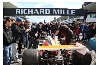
昨年のグリッドウォークの様子

各チケットの特典等の詳細は、公式ウェブサイトをご確認ください。 www.suzukacircuit.jp/soundofengine/