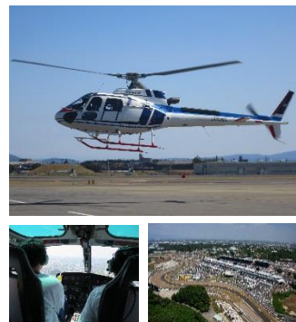
ヘリコプターで上空から鈴鹿サーキットを堪能 ※イメージ