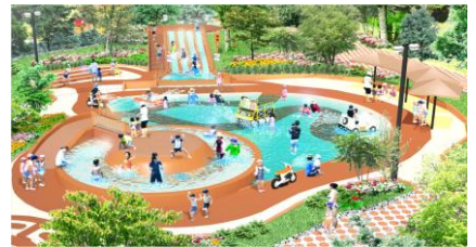
アドベンプッチ (全体イメージ)

“のりもの”や“探検家”になりきって 冒険が楽しめるキッズプール 「アドベンプッチ」が新登場!