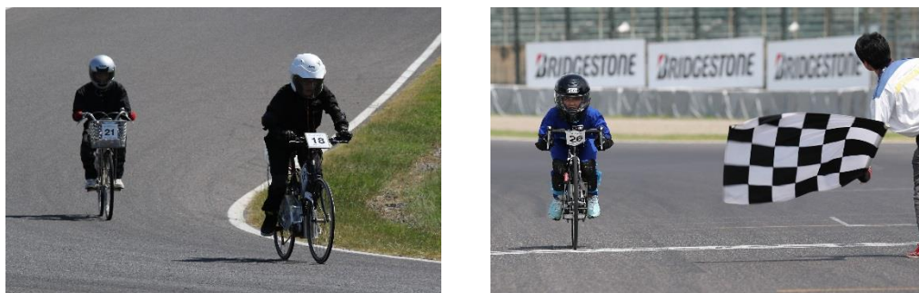
KV-BIKEチャレンジ 2016年レースの様子

参加クラスは、ライダーの重量55kg以上で大学・高専・専門学校、一般を対象とした「クラスⅠ」とライダー重量50kg以上で中学生、高等学校を対象とした「クラスⅡ」に分けられます。