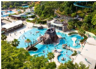
アクア・アドベンチャー