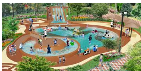
アドベンチャーパッチ(全体イメージ)

“みんなの冒険プール”「アクア・アドベンチャー」に、お子さまがのりものになりきって“ごっこあそび”が楽しめるキッズプール「アドベンチャーパッチ」が新登場します。このエリアには、幼児が主体的・自発的に楽しめる仕組みがあり、最大水深20cmの「ビーチロードプール」では、水中の道を突き進みながら勇者の証“パワーリング”を探す冒険をお楽しみいただけます。また、お子さま向けスライダー「パワーバトルスライド・ミニ」では、全長9mのコースをシグナルスタートを合図にお友達同士で競争することができます。さらに、水深30cmの「キッズアイランドプール」では、橋の架かった島の頂上“キッズアイランド”（高さ80cm・傾斜30度）から全方向へ滑り降りることができます。