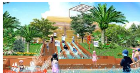
アドベンプッチ(パワーバトルスライド・ミニ イメージ)