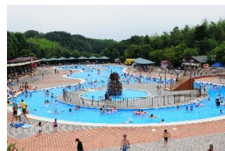
アドベンチャーリバー&アドベンチャーアイランド