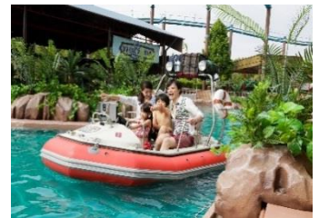
水着でアトラクション