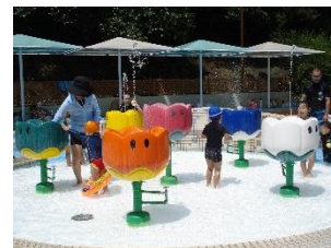
アクア・アドベンチャーベビー (キッズ流水プール&ベビープール)