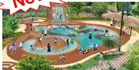
アドベンプッチ(全体イメージ)