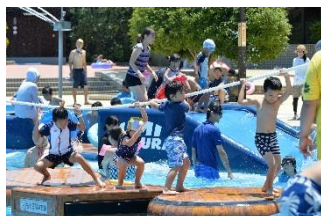
アドベンチャーウェーブ