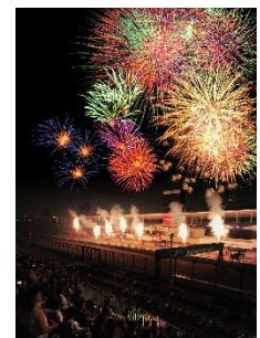
コチラレーシング モータースポーツ花火