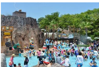
どっば〜ん！びしょぬれ！ スプラッシュパーティー