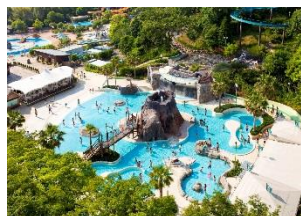
アドベンチャープール

「冒険・発見・体験」にチャレンジでき、家族や仲間と「できた！が、いっぱい。」を体感できる「アクア・アドベンチャー」には、5種類のプールと2種類のスライダーがあります。日本初！※の“波の上のアスレチックプールエリア”「アドベンチャーウェーブ」をはじめ、自然の地形を活かした“山・川・滝”などの水遊びアイテムがある「アドベンチャープール」、未就園児のプールデビューに最適な「アクア・アドベンチャーベビー」など、家族みんなで冒険にチャレンジできるプールです。（※鈴鹿サーキット調べ）