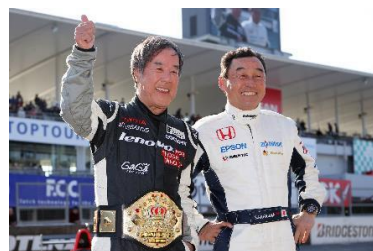
2015モータースポーツファン感謝デーでの星野一義氏(左)と中嶋悟氏(右)