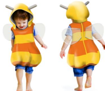
※なりきりプッチハッチイメージ