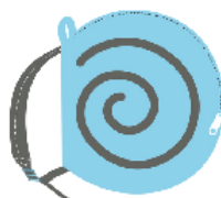
※でんでんリュックイメージ