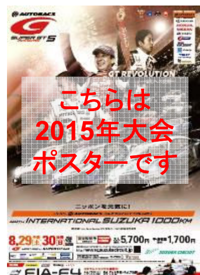
2015年の公式ポスター

タイヤメーカーテスト開催時には、先行販売チケット券種以外のチケット(VIPスイート、応援席チケット等)が販売されないため、当日遊園地入園料にてご入場されたお客様を対象に「2016 SUZUKA1000km大会公式ポスタープレゼント引換券」をお渡しいたします。ポスターは大会当日に引換を行う予定です。詳細については公式ホームページにてご案内いたします。