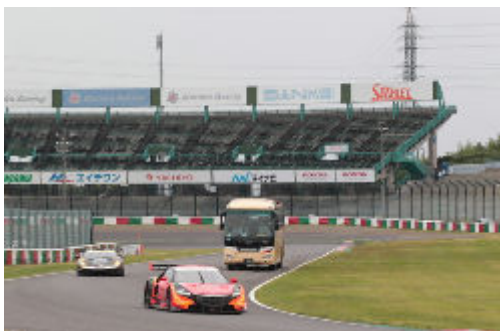
サーキットサファリの様子

※前売観戦券をお持ちでない場合は、各日有料(大人¥1,700、小学生¥800、幼児¥600)となります。