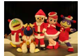
コチラファミリー。 左からプート、バット、 コチラ、チララ、ピピラ