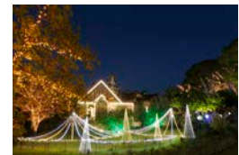
イルミネーション(イメージ)