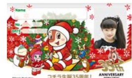
クリスマスカード(イメージ)

11月7日(土)~12月25日(金)にゆうえんちモートピアにて、「クリスマスカード」を期間限定で作成することができます(有料: 300円)。メンキョセンター、ライセンスセンターに加え、時間限定でモビステージの出張所では、コチラファミリーと一緒に写した写真入りカードを作成頂けます。