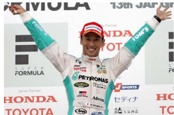
2014年最終戦でチャンピオンを獲得した中嶋一貴