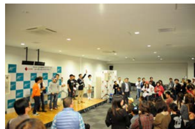
過去のシーズンエンドパーティーの 様子(イメージ)