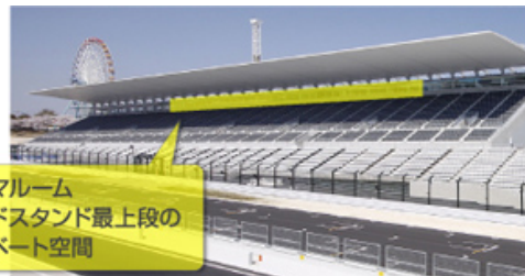
パノラマルーム グランドスタンド最上段の プライベート空間

パノラマルームはグランドスタンド最上段のプライベート空間。冷暖房完備の個室で、周囲を気にせずゆったりとご観戦いただけます。サーキットビジョンを見ながらの観戦や、さまざまな観戦エリアでお楽しみいただく際の荷物保管スペース、またお子さまと一緒のご家族にもおすすめです。特典としてピットウォークに参加することができます。