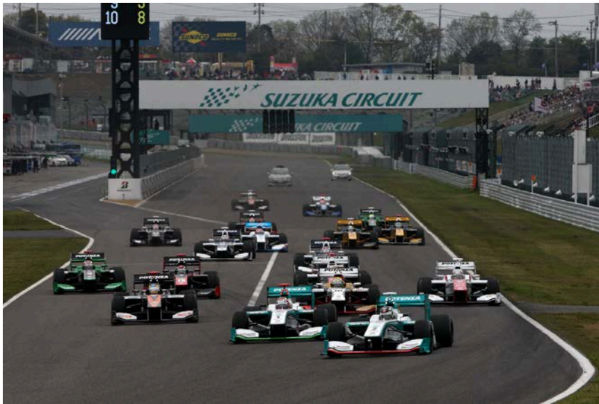
2015年第1戦(鈴鹿)のスタートシーン

なお、本レースの前売チケットは、9月13日(日)より販売を開始し、決勝日当日はゆうえんちモトピアパスポート(大人4,300円 子ども3,300円 幼児2,100円)でも観戦いただけます。