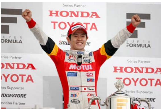
2013年最終戦でチャンピオンを獲得した山本尚貴