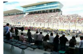
ホスピタリティラウンジ室内 バルコニー席