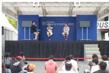
過去のステージイベントの様子 (イメージ)

ピットビル2階のホスピタリティラウンジで、ドライバー、関係者が参加してのシーズンエンドパーティーを行います。会場ではシーズン仮表彰式も行われます。