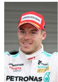
アンドレ・ ロッテラー

最終戦となる「JAF鈴鹿グランプリ」は今年も2レース制で開催される。優勝者にボーナスポイントが与えられる点が他のラウンドと異なる。2レース制では通常レースの半分、1位から8位まで5-4-3-2.5-2-1.5-1-0.5ポイントが与えられるが、優勝者には3ポイントが加算され、予選PP(ポールポジション)獲得にも1ポイントが与えられるため、2レースともPPから優勝すれば合計18ポイントを獲得できる。