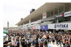
ピットウォーク(イメージ)

※小学生以下のお子さまは、無料でご参加いただけます ※前売りピットウォーク券完売の場合、当日ピットウォークは販売いたしません。お早めにお求めください ※ピットウォークには、脚立・傘の持ち込みはできません