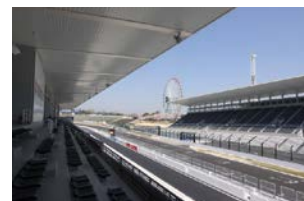
ホスピタリティテラス バルコニー席からの眺め