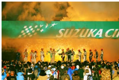
2014年スーパーフォーミュラ シーズンエンドセレモニーの様子