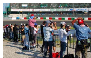
激感エリア(イメージ)