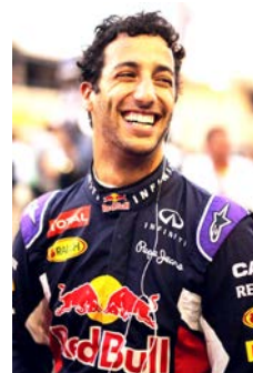
ダニエル・リカルド