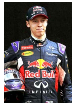
ダニール・クビアト