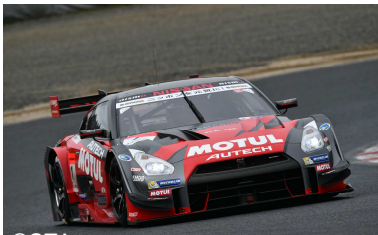
昨年チャンピオンのMOTUL AUTECH GT-R