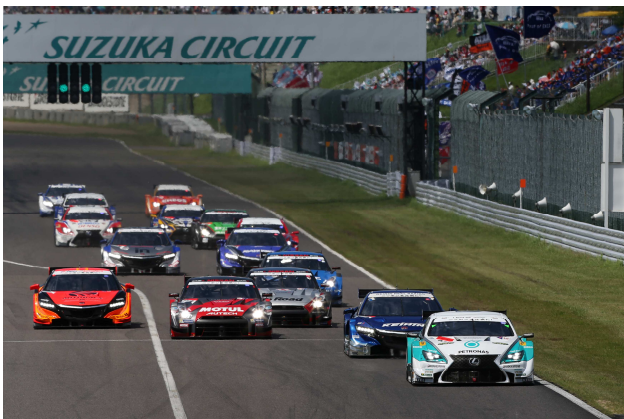
2014年鈴鹿1000kmスタートシーン

夏休み最後の週末、隣接するプールや遊園地、豊富な場内イベントとともに、迫力のレースを満喫できる、夏の鈴鹿サーキットならではの戦です。