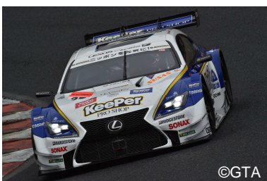
開幕戦優勝のKeePer TOM' S RC F

4月5日(日)に岡山国際サーキットで行われた開幕戦は、微妙に天候が変化する状況のなかで行われました。