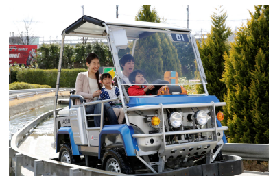
アクロエックス エボリューション