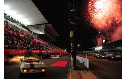
前夜祭イメージ (写真は2014年の様子です)

また、前夜祭のラストには、鈴鹿1000km決勝を翌日に、そしてF1日本GPを1ヶ月後に控えた、ドライバー・チームに向けたエールの花火を打ち上げます。