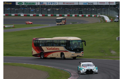
※サーキットサファリイメージ