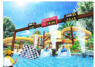
7月4日に登場する「パワーバトルスライド」 (イメージ)

また、ゆうえんちモートピアには、2015年3月に登場した「アクロエックス エボリューション」、「アドベンポート フロンティア」をはじめ、自分で運転し、ミッションにチャレンジするアトラクションが多くあります。アトラクションの多くは、水着のまま乗車することもでき、着替えの時間を気にせず楽しむこともできます。