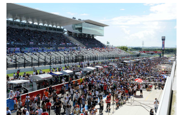
ピットウォークイメージ