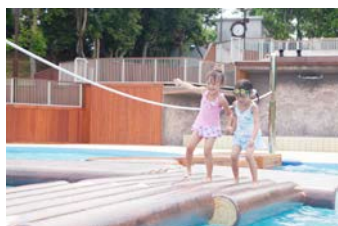
アドベンチャーウェーブ