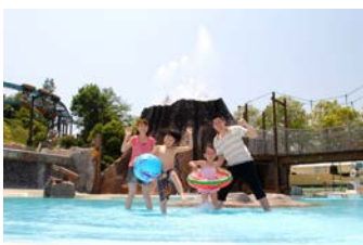
アドベンチャープール