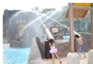
ウォーターキャノン