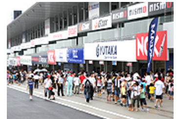
ピットウォークイメージ

※小学生以下のお子さまは、無料でご参加いただけます。 ※前売りピットウォーク券完売の場合、当日ピットウォークは販売いたしません。 ※ピットウォーク時の脚立の持ち込みはご遠慮ください。