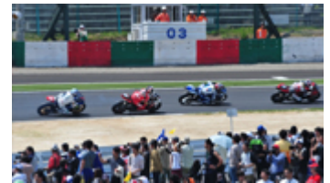
激感エリアイメージ

予選日11月2日(土)、決勝日3日(日)に開催するピットウォークにご参加いただけます。