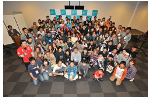
2012年のシーズンエンドパーティの様子