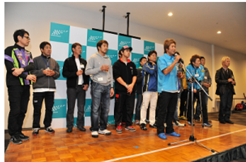
2012年のシーズンエンドパーティのオープニング