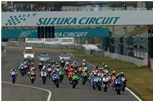
2013鈴鹿2&4レース JSB1000スタートシーン

なお前売観戦券の発売と、シーズンエンドパーティのお申込受付はいずれも9月1日(日)より開始いたします。