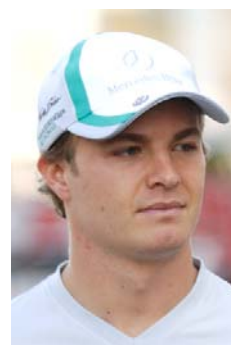
ニコ・ロズベルグ

大会名称 : 2011 CIK-FIA 世界カート選手権(KF1) (英語表記) 2011 CIK-FIA World Karting Championship (KF1) 併催レース : 2011 CIK-FIA アジアパシフィックKF2 選手権 (英語表記) 2011 CIK-FIA Asia-Pacific KF2 Championship 特別レース : 2011 FP-Jr CHALLENGE KART RACE IN SUZUKA オフィシャルパートナー : CRG JAPAN / TONY KART JAPAN CO.,LTD.