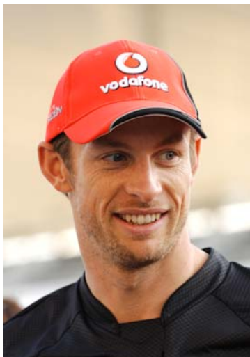
ジェンソン・バトン

1991年のワールドカップ カートレース初開催以来、鈴鹿サーキット国際南コースは数々のF1ドライバーを輩出してきた。今年チャンピオン争いをくり広げ、今年のF1日本グランプリの記者会見で「130Rの手前にあるカートコース(国際南コース)は、1996年と97年に走ったんだ。グランプリ・サーキット並みに見事で、今まで走ったカートコースの中では最高のサーキットだよ」と語ったジェンソン・バトン(マクラーレン・メルセデス)を筆頭に、フェルナンド・アロンソ(フェラーリ)、ニコ・ロズベルグ(メルセデスGP)、ヤルノ・トゥルーリ(チーム・ロータス)など、鈴鹿国際南コースでの活躍を原点としてF1にまで登りつめたドライバーは多い。テクニカルかつハイスピード、難しい国際南コースを攻略することは、実力を世界にアピールすることでもある。今年も新しいF1候補生が現れるはずだ。