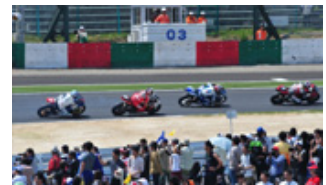
過去の激感エリアの様子