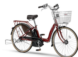
電動アシスト自転車「PAS」