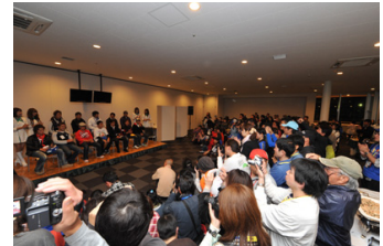
2010年のシーズン年度パーティーの様子

■日 時：10月30日(日) 17:00 受付、開宴 17:30、終宴 19:30