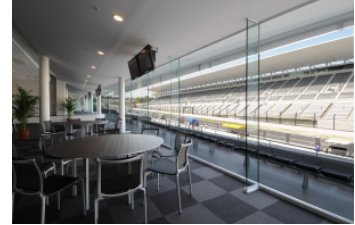
ホスピタリティラウンジ