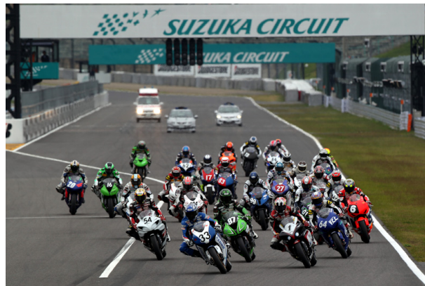
2010年MFJグランプリ、JSB1000のスタートシーン