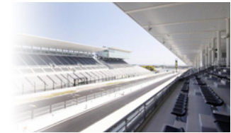
ホスピタリティテラス

1コーナー手前イン側・2コーナーイン側・S字コーナーの激感エリアにご入場いただけます。 ※安全確保のため、一部エリアへは各レース決勝時スタート~3周目までは入場を制限させていただきます。ご了承ください。