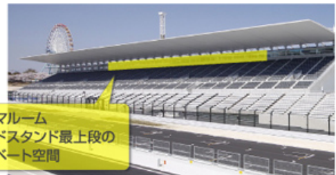
パノラマルーム グランドスタンド最上段の プライベート空間