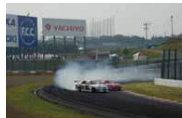
(写真)2008 D1グランプリ 第3戦