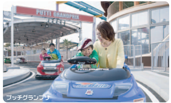
ブッチグランプリ

2010年3月には“子どもが主役”の「コチラのブッチタウン」が、家族で協力すればもっと楽しくなる仕掛けを満載して生まれ変わりました。