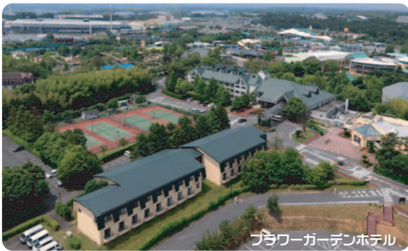
フラワーガーデンホテル

また2011年2月26日(土)に別館ラベンダーが全室「ファミリールーム」となって生まれ変わり、さらに小さなお子さま連れの家族にも快適に過ごせるお部屋となります。