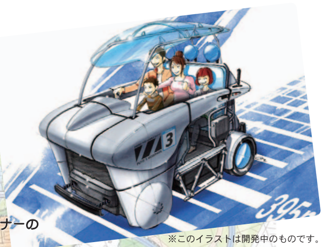
※このイラストは開発中のものです。

370m以上走ると「エネワンライセンス 銀」、400mを完走すると「エネワンライセンス 金」が発行されます。