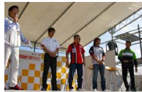
2009年のライダートークショーの様子