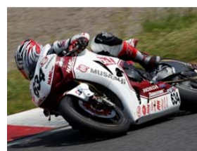
2010 鈴鹿2&4レース MuSASHiRTハルク・プロの 走り