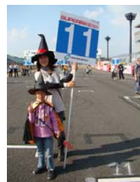
2009年のグリッドキッズの様子