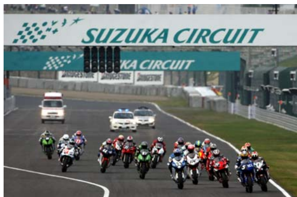
2009年MFJグランプリのスタートシーン

その予選は、すでに馴染みの深いノックアウト方式。クオリファイ1(Q1)からQ2、そして最終のQ3と、ライダーとチームの見せる戦略に注目したい。Q3に残ることはトップライダーとして、そしてトップチームとしてのプライドだが、今大会では、ポールポジションをかけた熱い予選になることは必至なのだ。