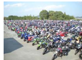
2009年のイベント会場