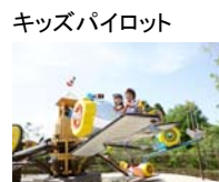
キッズパイロット