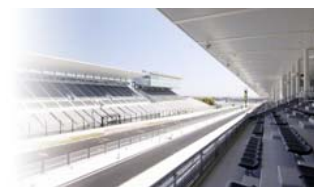
ホスピタリティテラス

※パドックパスのご購入には観戦券が別途必要です。 ※ホスピタリティテラス(ピットビル2階)にはご入場いただけません。 ※前売りパドックパス完売の場合、当日パドックパスは販売いたしません。