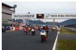
2009年のイベント風景