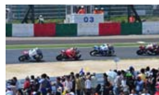
過去の激感エリアの様子