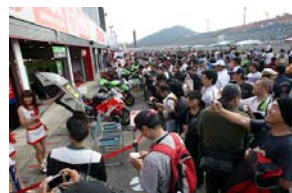
2009年のピットウォークの様子