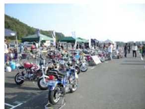
2009年のイベント会場