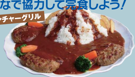
アドベンチャーグリルの山くずしハヤシ ¥2,500