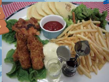
ふんぶんファミリー ¥2,800