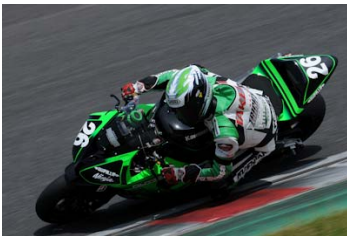
TRICK☆STAR RACING ※鈴鹿2&4レースにて

また、昨年の8耐3位のHonda DREAM RT桜井ホンダは、この鈴鹿300kmでは亀谷長純の単独エントリーとなるが、8耐発表会でパートナーが明かされるか注目される。さらに、昨年の8耐で2位となり、今年は渡辺篤を擁して鈴鹿300kmに参戦するTRICK☆STAR RACINGは、使用するマシンKawasaki Ninja ZX-10Rのネーミングにちなんで、伊賀流忍者のふるさと伊賀市伊賀上野の社団法人伊賀上野観光協会とジョイント。レースはもちろん、プロモーションにも注目したい。そしてアプリリアやBMWの鈴鹿300km参戦などもあり、8耐前哨戦にして早くも話題はヒートアップ状態。いよいよ今年の8耐からも目が離せなくなってきた。