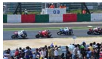
激感エリアの様子

※安全確保のため、一部エリアへは各レース決勝時スタート～3周目までは入場を制限させていただきます。ご了承ください。