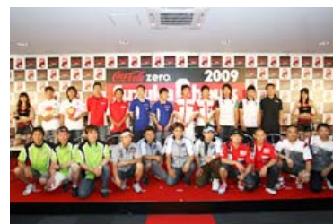
2009年の発表会の様子