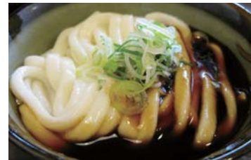
「伊勢うどん」など、ご当地グルメを味わうことも。

※写真はイメージです。イベントなどの予定は、予告なく変更する場合がございます。予めご了承ください。