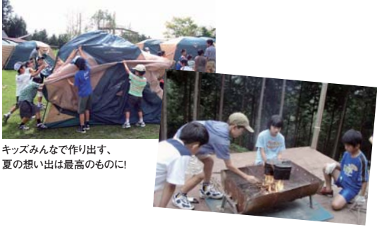
キッズみんなで作り出す、夏の思い出は最高のものに!

8耐の3泊4日キャンププログラムが誕生しました。 3泊4日のメニューは、バイク教室のほか、救急スキル学習、コースオフィシャル体験、野外炊飯など多岐に渡ります。鈴鹿サーキットの広大な森と、回りの自然を利用し、8耐ならではのプログラムが折り込まれたキャンプです。