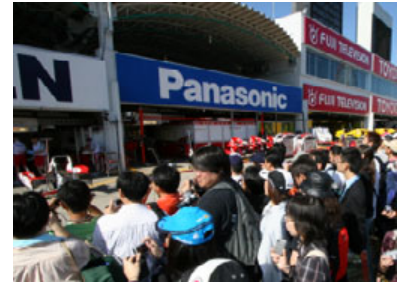
※ピットウォークの様子(2005年開催時)