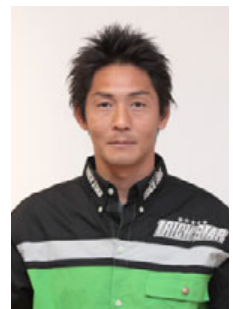
今シーズン復帰する 元チャンピオン井筒仁康 (Photograph of 2009)