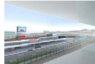
パノラマルームからの眺め ※イラストはイメージです

※MOBILITY STATION(オンラインショッピングサイト※PC・モバイルサイト)からお申込みください。受付期間:2月19日(木)10:00~4月12日(日)24:00まで