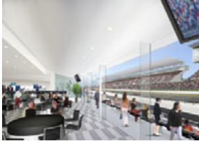
※イラストはイメージです

新ピットビルディング2階に設けられたホスピタリティラウンジはハイグレードな観戦ルームに加えて、ピットレーンに張り出した屋外テラス席を設置。鈴鹿サーキットはおもてなしの心とともに、快適で迫りに満ちた観戦をご提供いたします。