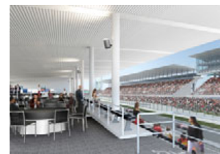
※イラストはイメージです