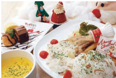
クリスマスプレート 1,500円 ■場所: プッチタウンキッチン

イベント期間中、プッチタウンキッチンをはじめ園内各所のレストランには、クリスマス限定メニューが登場します。このシーズンだけのスペシャルメニューをぜひ召し上がれ!