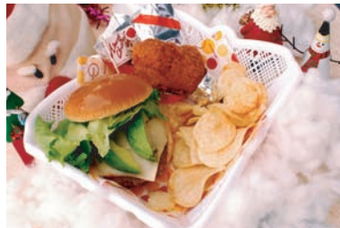
クリスマスバスケット 1,000円 ■場所: プーランジュリー