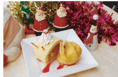
でんでんサンタケーキセット 600円 ■場所: プッチタウンキッチン