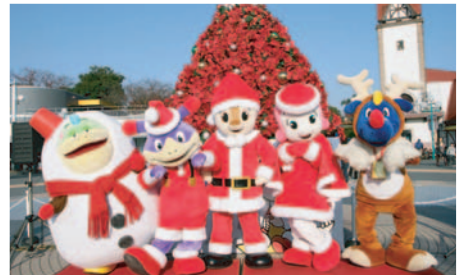
コチラファミリーがプレゼントを持って、お部屋に遊びに来てくれるよ。※キャラクターの指定不可。