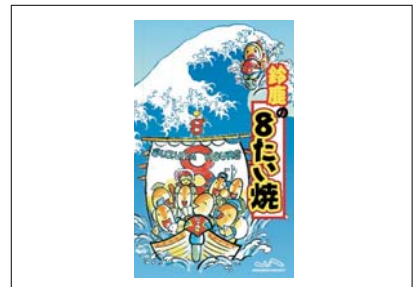
鈴鹿の8たい焼...¥600 (たいやき8個入り)