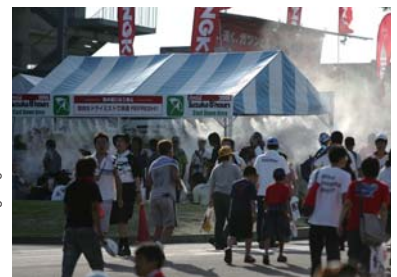
※イベント内容等は変更される場合があります。