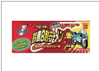
ベビースター 鈴鹿8耐ラーメン...¥350

地元・三重県のお菓子メーカー「おやつカンパニー」と8耐がコラボレーション! 人気の「ベビースター 鈴鹿8耐ラーメン」を、今年も会場にて販売。完売必至のため、お求めはお早めに! そのほかにも、8耐定番の名産品も続々登場。