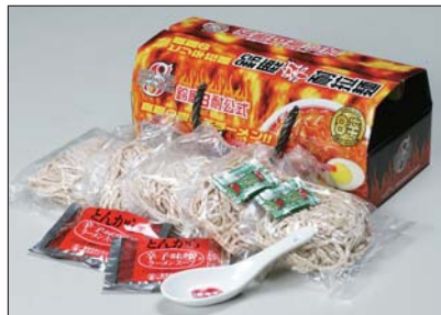
鈴鹿辛耐ラーメン...¥1,000 (5食入、おまけ「8耐れんげ」1個入り)