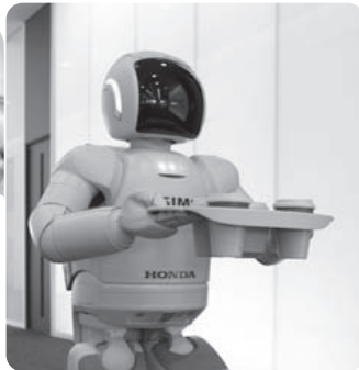
新型ASIMOはトレイも運べるよ!