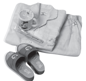
キッズアメニティ