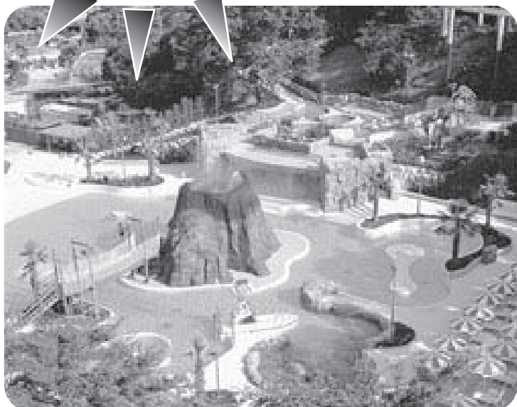
水が山頂から吹き出す、アクアラグーン「噴水火山」。

広大な森の緑に囲まれた「アクア・アドベンチャー」は、リゾート気分をたっぷり味わえるプール。総面積23,000㎡を誇る敷地内には、鈴鹿サーキットならではの楽しみと思いが多く込められています。