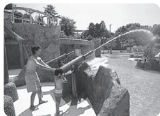
大砲から水を噴出! アクアラグーンの「ウォーターキャノン」。