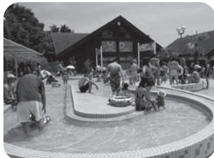
小さなお子様も楽しめる、水深30センチの「キッズ流水プール」。