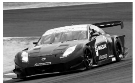
ニッサン・フェアレディZ