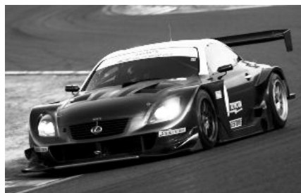
トヨタ・レクサスSC430