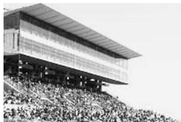
※VIPテラスは完売いたしました