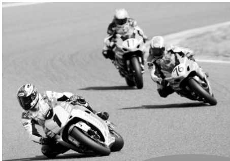
全日本ロードレース