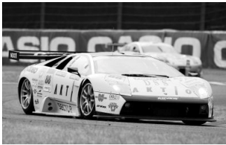
昨年のSUPER GT開幕戦(鈴鹿)で優勝したムルシエラゴ

'94年にカウンタックで全日本GT選手権(現在のSUPER GTシリーズ)に参戦。昨年の開幕戦鈴鹿ラウンドでは、ムルシエラゴが見事GT300クラス優勝を飾った。レースシーンでのランボルギーニ車優勝はこれが初めての快挙だった。そのJLOCが今年創立20周年を迎えるのを記念し、イベントが行われる。