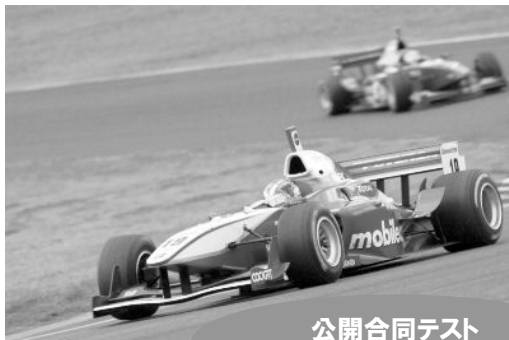
フォーミュラ・ニッポン