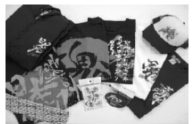
F1日本グランプリオリジナル魂シリーズ