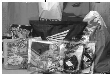
サンクスセット(福袋)