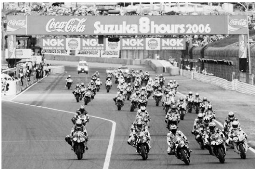
"コカ・コーラ"鈴鹿8時間耐久ロードレース