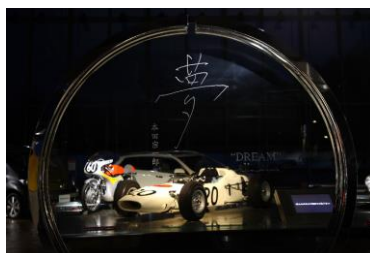
ナイトミュージアム イメージ