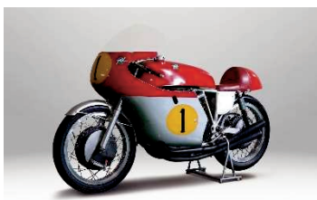
MV アグスタ 500 FOUR(1965年) マイク・ヘイルウッド