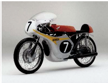
ホンダ 2RC143(1961年) マイク・ヘイルウッド マン島TTレース初優勝