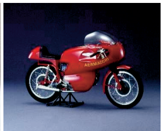
アエルマッキ ハーレーダビッドソン アードーRS(1965年)