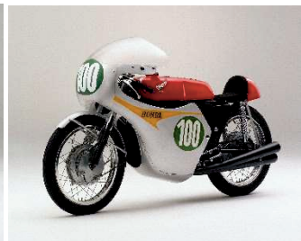
ホンダ RC162(1961年) 高橋国光