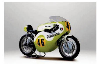
カワサキ H1R(1970年)