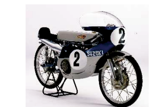
スズキ RK67(1967年) ※展示車は#8仕様