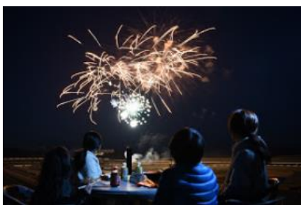
ゆったりと花火鑑賞できるテーブル席エリア