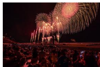
自由席 スーパースピードウェイアリーナ

目線の高さで打ち上げ花火を鑑賞できる指定席券です。 自由席観覧券やグループチケットのオプションとしてご利用いただけます。