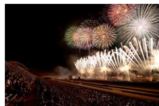
指定席 A席・B席エリア