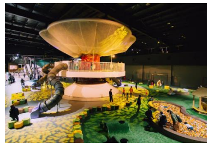
新アトラクション「巨大ネットの森 SUMIKA」