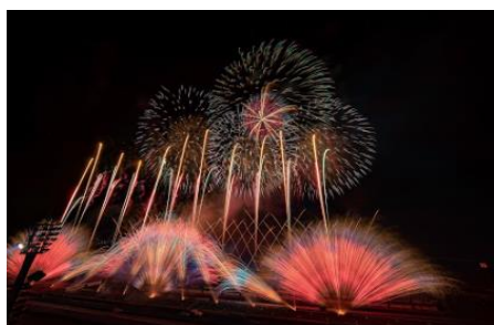
国際レーシングコースを舞台にした劇場型花火

人気のアトラクションや涼しい森での森林浴、びしょぬれイベントに参加しながら日中も満喫できます。