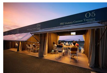
ビクトリーコーナーテラス プレミアム