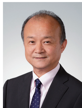
株式会社モビリティランド 取締役社長

最後になりますが、ファンの皆様、地元の皆様、メディアの皆様、そして FIM、MFJ をはじめとする関係団体の皆様に、厚くお礼申し上げます。