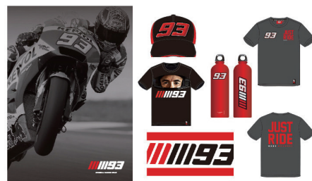
マルケスグッズイメージ