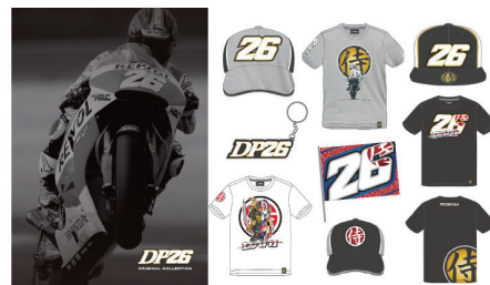
ペドロサグッズイメージ