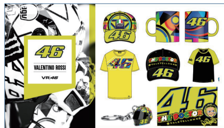
ロッシグッズイメージ