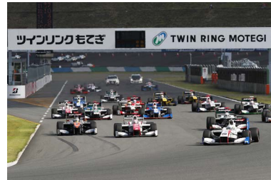
2016年ツインリンクもてぎ2&4レース スーパーフォーミュラ スタートシーン