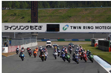
2016年スーパーバイクレース in もてぎ JSB1000クラス スタートシーン