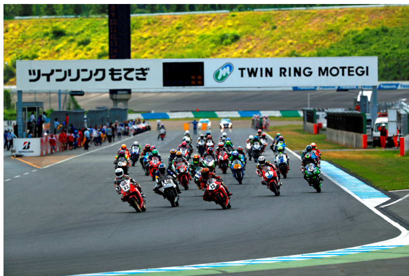
2016年の“もて耐”スタートシーン

1998年8月の第1回大会以降、回を重ねるごとに盛り上がりを見せ、2016年は147台のエントリーを数えた“もて耐”は、もてぎ開業20周年の2017年に最大エントリーを200台まで拡大し、さらに多くのファンに親しまれる“もて耐”へと進化します。