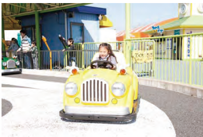
ピンキードライブ