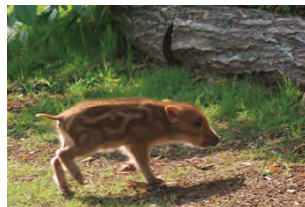
ハローウッズに生息する動物たち