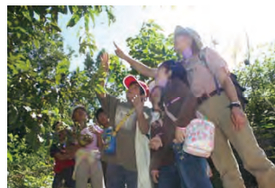
自然体験プログラム