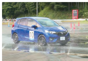
人工雪路走行体験