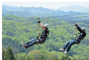
メガジップライン つばさ