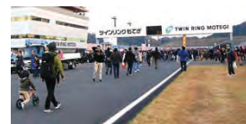
家族みんなでコースウォーク