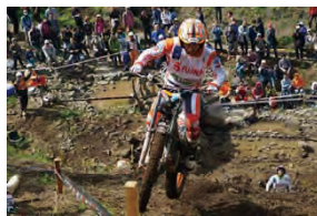
トライアル世界選手権