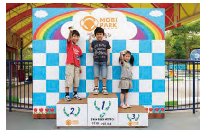
モビパーク内にある表彰台