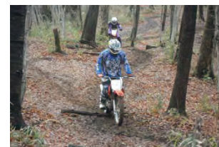
山道トレッキング