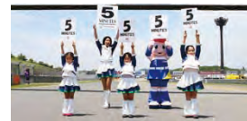
スタート直前！ドキドキのカウントダウンボードアップ！