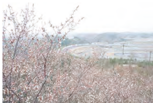
春のハローウッズ