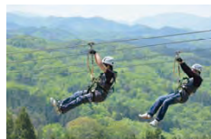
メガジップライン つばさ