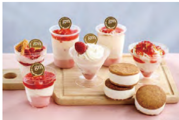
ジェラート マスモ(イメージ)

ジェラート マスモ：栃木県産のいちごやミルクなど地元の食材にこだわったジェラートが人気のお店 ドルチェ ミエーレ：約100年の歴史がある老舗、黒田養蜂園ならではの厳選されたハチミツを使ったジェラートは絶品