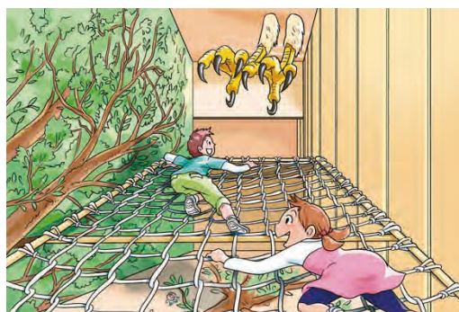
迷宮森殿 ITADAKI イメージ