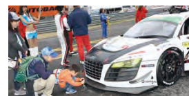
ファミリーグリッドウォーク

※各イベントの詳細はツインリンクもてぎホームページ( http://www.twinring.jp/ )をご覧ください。