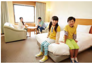
ホテルツインリンク(イメージ)

ゆったりとお過ごしいただける広々とした客室からは、ツインリンクもてぎの自然やレーシングコースを一望でき、夜には満天の星を眺められます。ホテル内には「のぞみの湯」や、地元栃木県産の美味しい食材を使った料理をお楽しみいただける「森のレストランMARCHERANT(マルシェラン)」があり、リゾートならではの贅沢なひとときをお過ごしいただけます