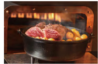
森のレストランMARCHERANT (イメージ)