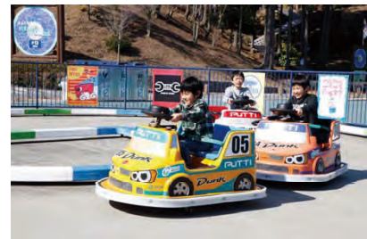
ドリフトキッズレーサー