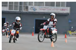
親子のバイク教室