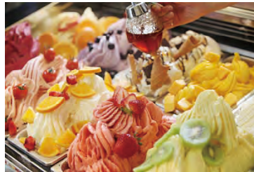
黒田養蜂園が手がける 「ドルチェ ミエーレ」(イメージ)