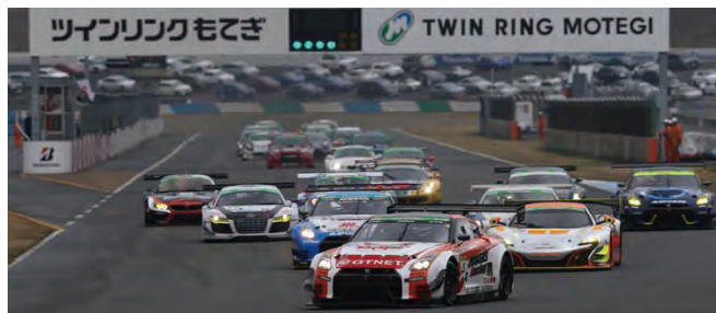
2016年スーパー耐久スタートシーン

4月1日(土)・2日(日) スーパー耐久開幕戦は、春のいただきまつりの期間中に開催します。