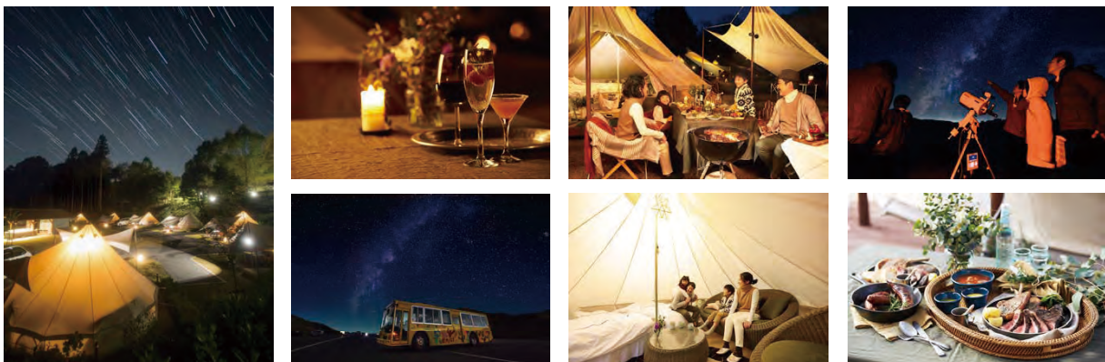
森と星空のキャンプヴィレッジ(イメージ)