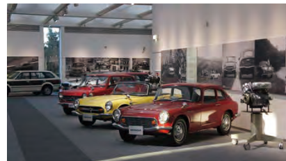
Honda Collection Hallの各フロア