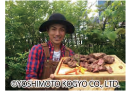
たけだバーベキュー