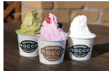
森のジェラテリア ROCCO (イメージ)