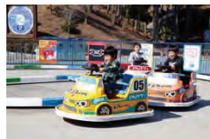
ドリフトキッズレーサー

大人観戦券をお持ちの方にモビパークパスポートを無料でプレゼント。さらには、子ども・幼児観戦券をお持ちの方は割引価格で販売いたします。新登場の「迷宮森殿 ITADAKI」をはじめ、最大15種類のアトラクションを思う存分、何度でも体験でき、ご家族でお得にツインリンクもてぎを満喫いただけます。