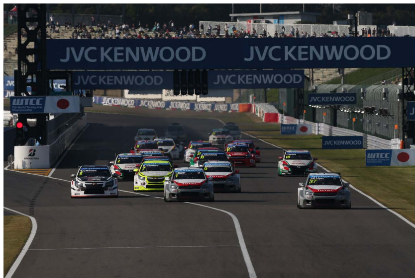
2014年WTCC日本ラウンド(鈴鹿)レース1スタートシーン