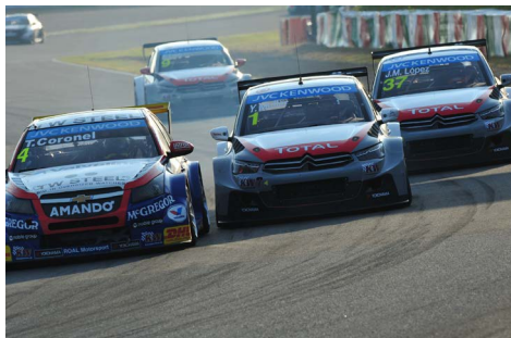
2014年日本ラウンド(鈴鹿)でのバトルシーン

そしてメインストレートアウト側にはコースに隣接したV席スタンドを設置。WTCCならではの迫力シーンを間近でご覧いただけます。初めてのツインリンクもてぎでどんな戦いが展開されるのか。日本のみならず、世界のファンが注目する一戦です。