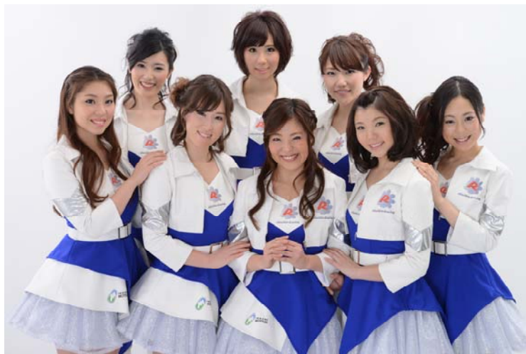
現在活動中の ツインリンクもてぎエンジェル

ツインリンクもてぎで開催するレース・イベントのアシスタントとして活動するだけでなく、首都圏で開催されるイベント会場でのプロモーションや、北関東三県(栃木県・茨城県・群馬県)での地域活動を通じて、積極的にツインリンクもてぎの魅力をPRする、明るく健康的で活発な女性を募集いたします。