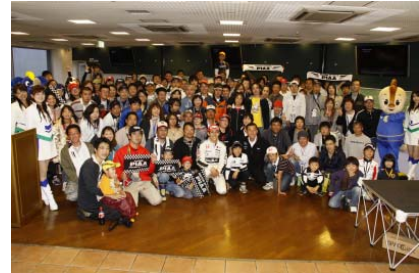
昨年の祝勝会の様子

※プレゼントのないチームもございますので、あらかじめご了承ください。 ※プレゼントは受付にてお渡しします。