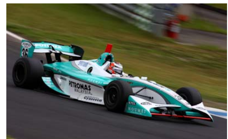
フォーミュラ・ニッポンマシン「FN09」

その新生フォーミュラ・ニッポンも2年目を迎え、何もかもが新しく手探り状態から始まった昨年と違い、サーキットをより速く走るためのデータは揃った。そしてドライバーたちもフォーミュラ・ニッポンの走りをマスターし、昨年を上回るスピードでのレースが展開されるのは確実だ。フォーミュラ・ニッポン史上最速のバトルが期待される。