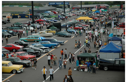
スーパーアメリカンサンデー開催時の会場風景

今回のテーマは「マッスルカー ※1 」。1960年後半～70年代に製造されたシボレー・カマロ、シボレー・シェベル、ポンティアック・GTOなどを中心とした2ドア、NA、V8エンジンなどを搭載した車両と、現代販売されているシボレー・カマロ、ダッジ・チャレンジャー、フォード・マスタングなど21世紀のマッスルカー復刻版が集結し、会場全体がアメリカンな雰囲気になります。