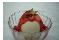
▲アメリカン“ストロベリー” サンデー