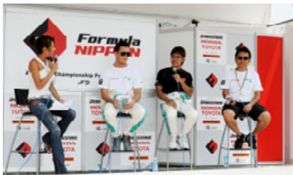
過去のドライバートークショーの様子

グランドスタンド手前のグランドスタンドプラザに設置された特設ステージでは、ドライバートークショー、キャンギャルオンステージなど盛りだくさんのイベントが開催される。