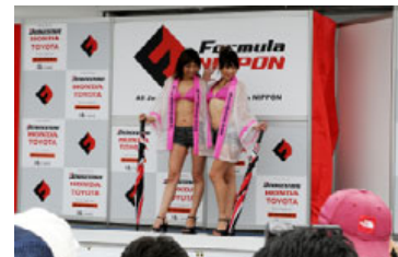
過去のキャンギャルオンステージの様子