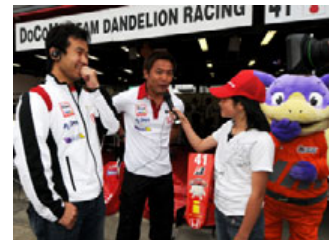
過去のKIDSピットレポーターの様子