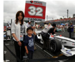
過去のグリッドキッズの様子