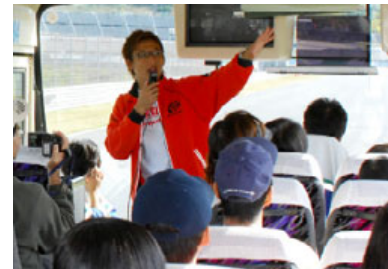
過去のKIDSバスツアーの様子