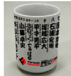
【特典5】オリジナルグッズ 「2009 フォーミュラ・ニッポン 湯のみ」