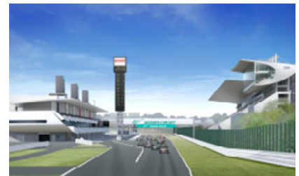
新ピットビル(左)と新グランドスタンド イメージ