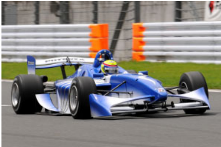
フォーミュラ・ニッポン ニューマシン FN09

2009年、フォーミュラ・ニッポンは新しい時代を迎える。 マシン、エンジンともに一新されパワー、スピード、そしてパフォーマンスのすべてがバージョンアップされるのだ。まずはこれまで通りヨタ、ホンダの2社が供給するエンジン。V型8気筒、3000ccから、同じV型8気筒ながら排気量は3400ccにアップされ、パワーは600馬力以上に達している。これまで経験したことのないハイパワーでレースが戦われることになったわけだ。シャーシ(車体)も新たにこれまでより一回り大きいFN09となり、フロントの2枚ウイング、独特の形状をしたリアウイング、ボディラインが目目を引く。これによってダウンフォースが増加。さらにオーバーテイクボタンも搭載され、豪快に前車を追い抜くシーンが多く見られることになりそうだ。また昨年末に行われたテスト走行では早くも時速315kmもの最高速を記録、鈴鹿・もてぎでの戦いはファンに大迫力で迫ってくるはずだ。