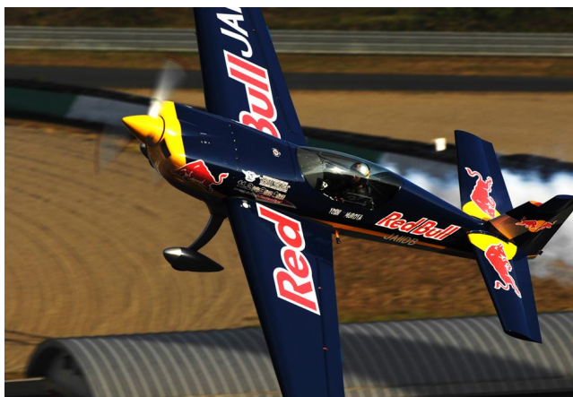
※写真は2007年の競技の様子です。

競技の審査には、FAIの審査委員の審査に加え、観戦する人々の審査も取り入れているところも本大会の魅力の一つです。