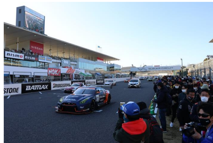
パルクフェルメウォーク