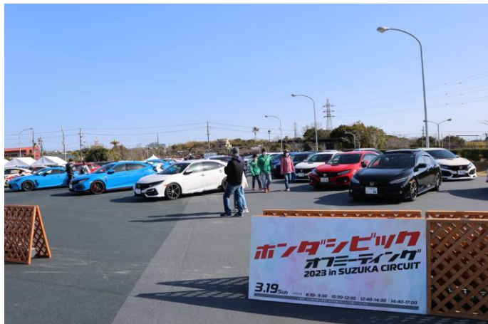
オーナーズパレード