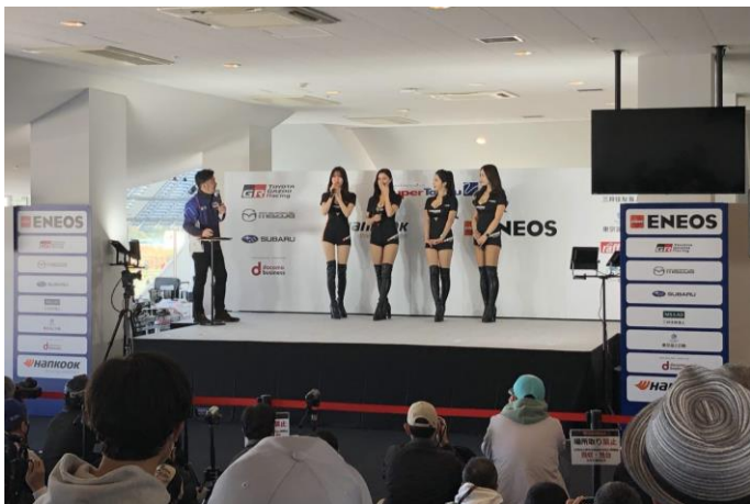
スーパー耐久オフィシャルステージ