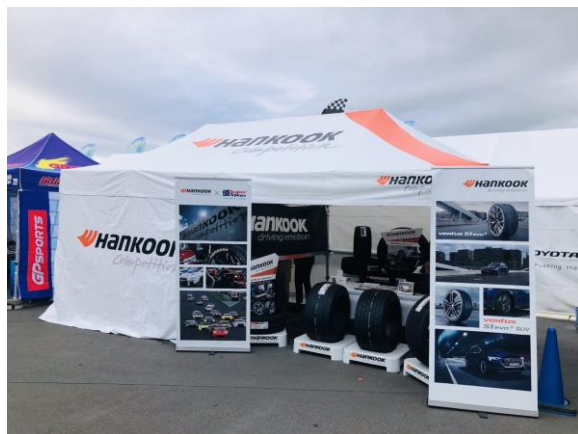
ハンコックタイヤジャパン