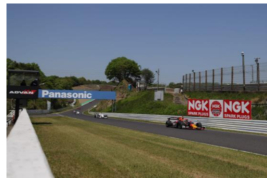
NGKスパークプラグ 西ストレート