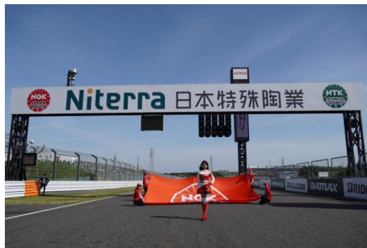
フラッグセレモニー