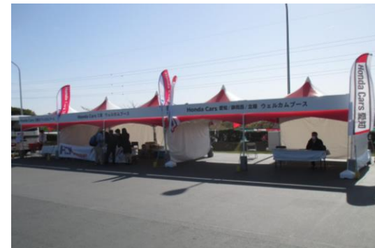
Honda Cars ウェルカムブース