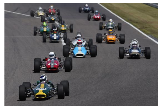
Historic Formula Resister デモンストラーションレース