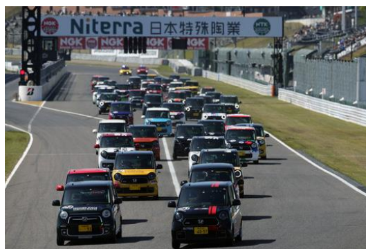
N-ONE OWNER'S CUP