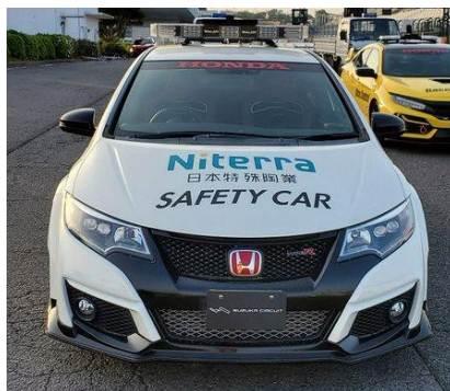
マーシャルカーラッピング