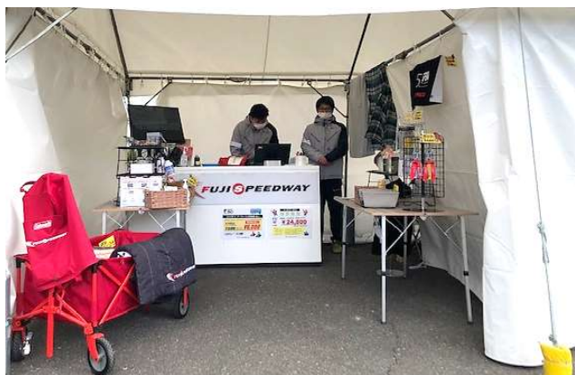
富士スピードウェイ