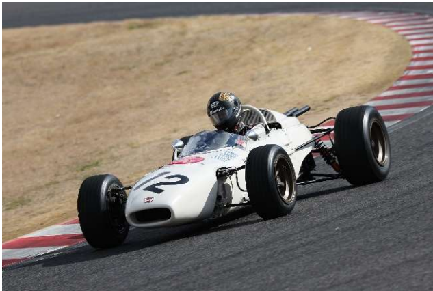
鈴鹿サーキット 夢の原点