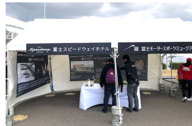
富士スピードウェイホテル/富士モータースポーツミュージアム