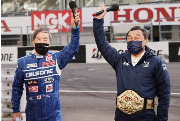
永遠のライバル対決～60周年スペシャル～