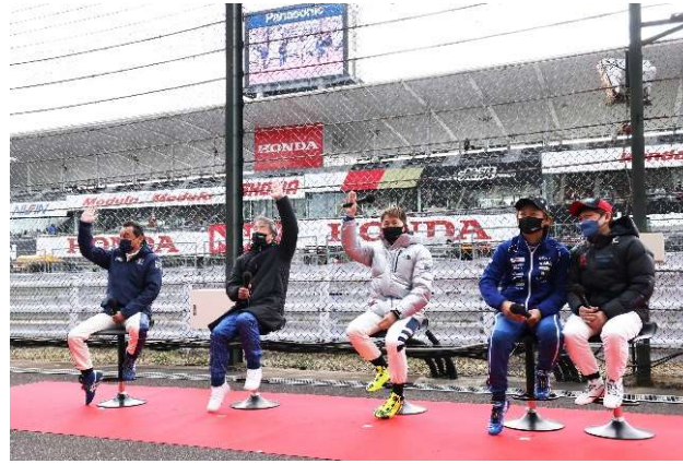
永遠のライバル対決～60周年スペシャル～