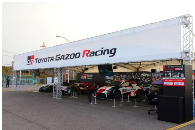
TOYOTA GAZOO Racing