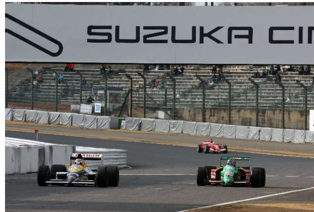
世界の鈴鹿へ F1日本グランプリ