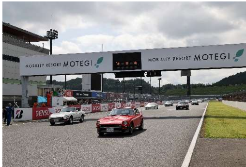
パレードラン (日曜日：フェアレディZ,CR-Xなど)