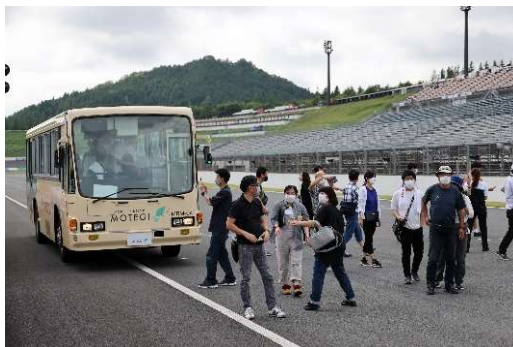
サーキットバスツアー