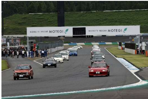
パレードラン (土曜日：シビック)